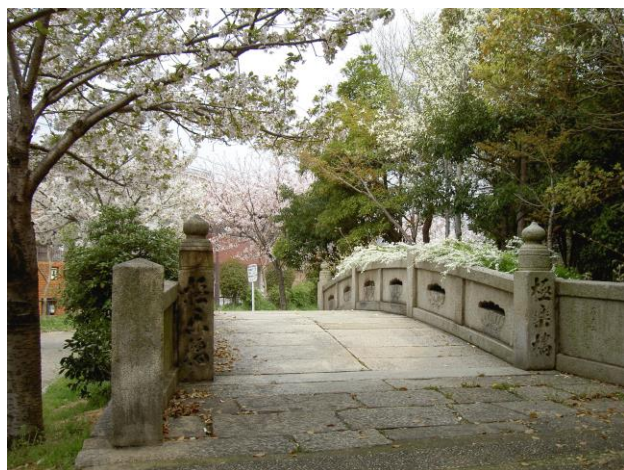
宿屋町東3丁土居川公園に残る極楽橋の欄干

13:00 出発 極楽橋～妙国寺～泉陽高校・殿馬場 中学（奉行所跡）～念勝寺など寺町～熊野小学校