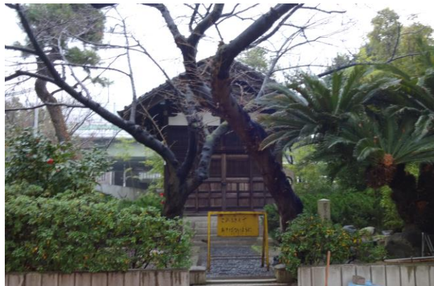
熊野小学校「玉座記念館」（東門のすぐ横）

堺の歴史と環濠・土居川について、ホットな発掘情報を含めて学びます。いっしょに歩き、学びましょう。