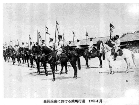
金岡兵会における乗馬行進 17年4月

子ども達に身近な金岡公園。しかし昔は陸軍駐屯地、米軍金岡キャンプだったことは地元でもあまり知られていません。軍隊や国の土地がどのように市民の憩いの場、スポーツ施設に生まれ変わったか。研究授業で扱った内容を報告します。堺での戦争と平和、声を挙げる大切さなども考えて頂ければ幸いです。数十年前といえ、資料や証言が乏しく、市役所や区役所、図書館に何度も問い合わせ、足を運びました。