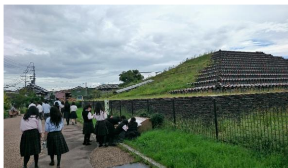
土塔で現地学習 東百舌鳥高校生